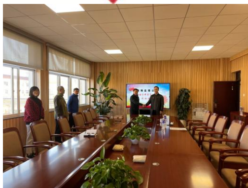
爱心助力安宁中学

点滴爱心聚沙成塔,爱心浇灌连木成林,近年来云南盛翔工程建设监理咨询有限公司在自身发展的同时始终不忘践行企业社会责任,积极倡导爱心公益,每年组织开展公益助学、扶贫帮困、关爱儿童、关爱环境等活动,始终坚持将发展企业与践行企业社会责任紧密结合,以实际行动履行一个企业的社会使命。 【王晓蕾】