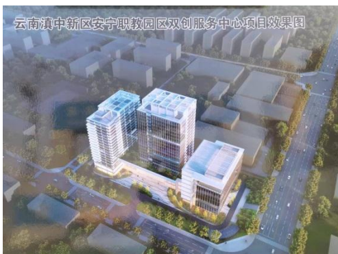
项目建成后的效果图

人员同步进场，目前已完成临建及开工的准备工作，已开始基坑支护相关工作，项目总工期为两年，预计2024年初建成投入使用。【姚鹏】