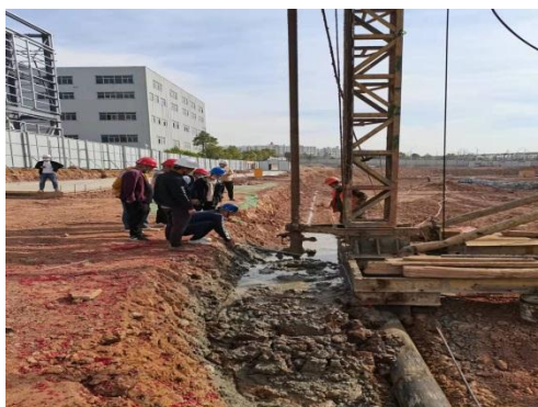
深基坑支护深层搅拌桩施工监理现场交底及过程检查