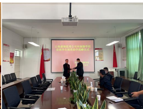
爱心助力安宁市禄脰学校