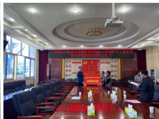
爱心助力八街6户贫困家庭