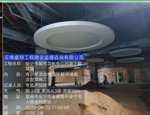
青少年活动中心施工实况照片