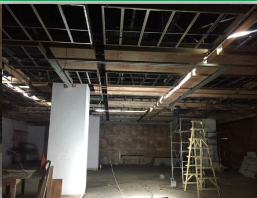
文化馆施工实况照片