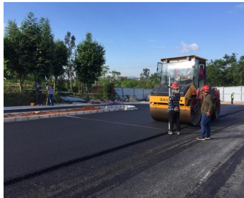
监理、施工一同测量机动车道沥青路 面（面层）铺筑厚度和标高