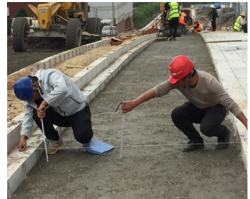
监理工程师检查非机动车道水稳层 铺筑厚度及标高

安宁市城市基础设施PPP项目（一期）职教基地7号道路项目沥青路面的及早完工，为云南理工学院师生的学习和生活创造了良好的环境。 【夏继鹏】