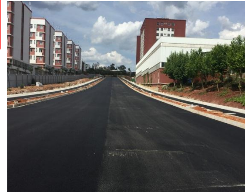
铺筑完成的道路沥青路面