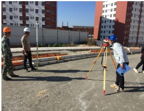
监理工程师测量机动车道水稳层 铺筑厚度和标高