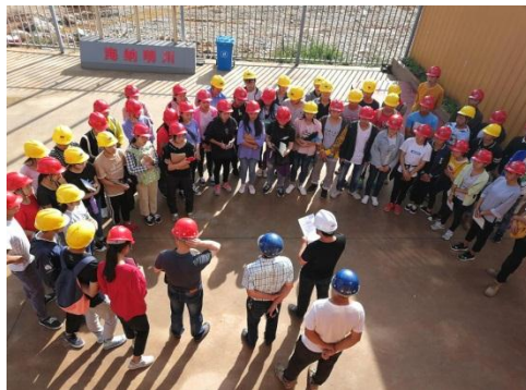
向高校实习生安全交底