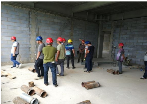
参建各方现场处理问题