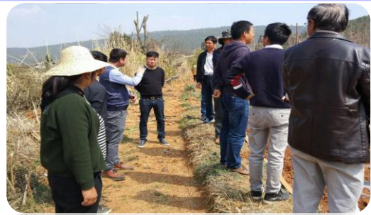
交通局、质量监督站领导检查工地