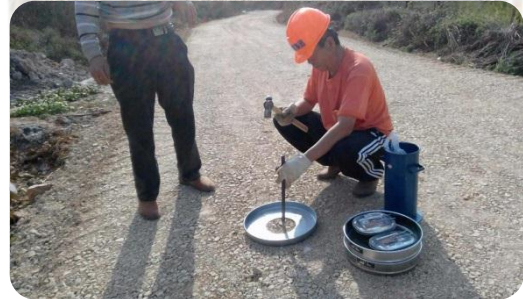
交通局相关领导现场检测路基