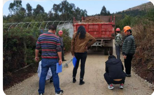
交通局、质量监督站相关领导参与路基弯沉检查