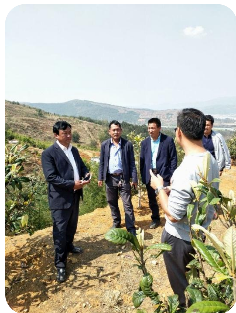
郭副总就绿色生态肥料技术做推广