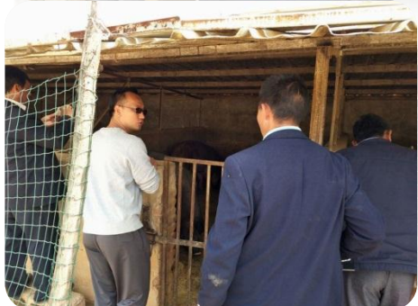
郭副总向村委会同志介绍养殖技术