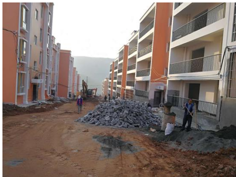
正在施工中的室外附属部分