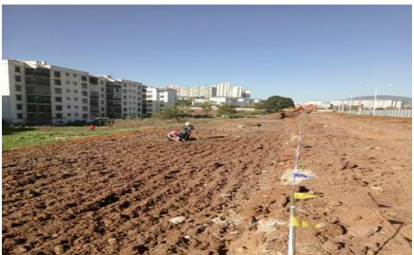
管廊基底软基换填