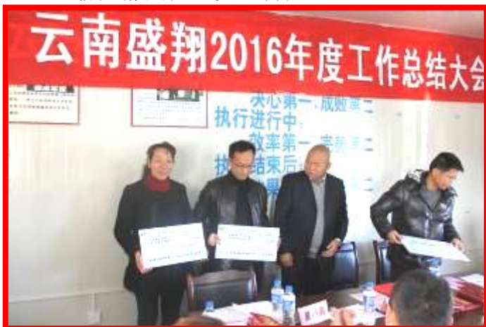
各公司目标承诺兑现