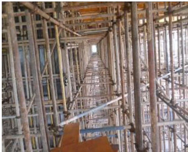
模板支架立杆垂直度