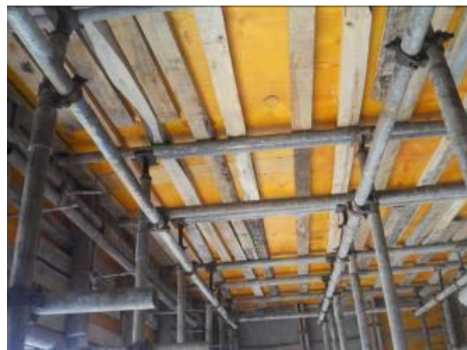
模板支架最顶层水平杆位置和可调托撑悬臂长度