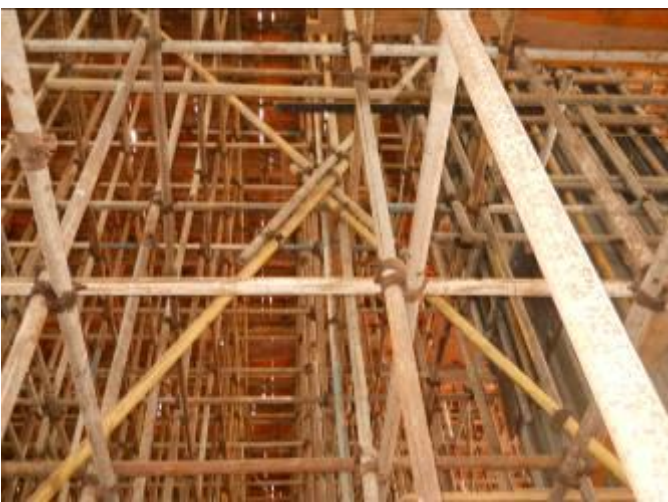
模板支架垂直剪刀撑