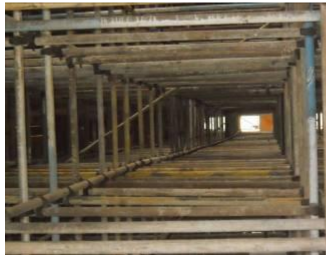
模板支架中间水平杆