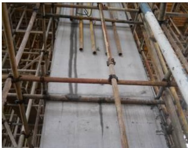
模板支架与框柱连接(抱柱)