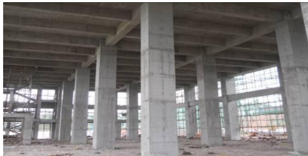
包装材料厂一层梁板拆模后的实况