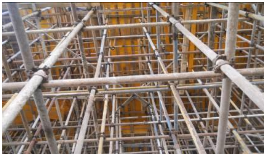
模板支架整体搭设效果

监理通过以上一系列控制工作,保证了模板支架的强度和刚度满足需求,最终确保了包装材料厂一层主体梁板结构混凝土浇筑的施工安全。