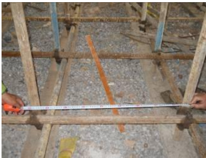
模板支架立杆间距